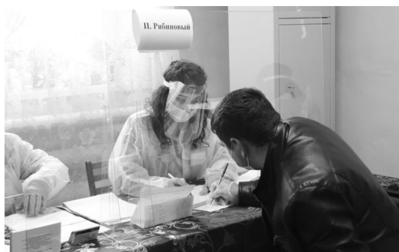
В посёлке Рябиновом избирательный участок размещается в фельдшерском пункте. Помещение небольшое, но требования избирательного законодательства и санитарно-эпидемиологических норм соблюдаются в полной мере. На этом участке за три дня выборов проголосовало 242 человека.

Ваш депутат Государственной Думы Максим Иванов