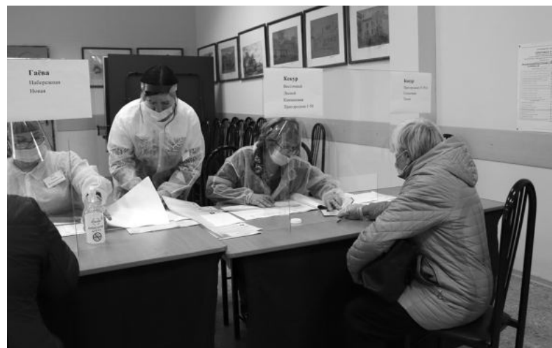
В деревне Гаёва выборы идут полным ходом. Участковая избирательная комиссия № 355 ждёт избирателей, проживающих в деревнях Гаёвой и Кекуре, в посёлке Дорожном. Заявления для голосования на дому также принимались из трёх населённых пунктов.